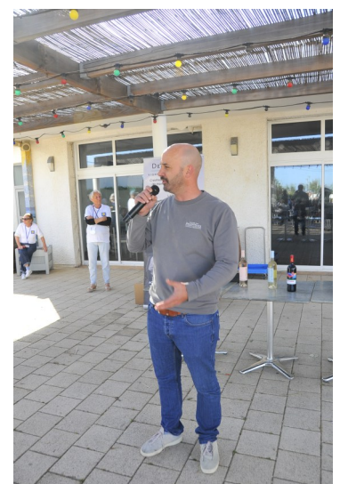
Intervention du directeur de la cave coopérative du Cellier des Demoiselles avant dégustation