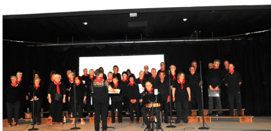
La prestation remarquable et très appréciée de la chorale « Le Chiffon Rouge.